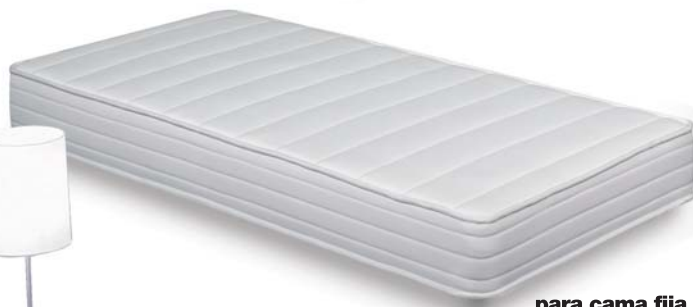
para cama fija CP06036

Base recomendada para CP06034: Somier articulado Futurtem SR02065