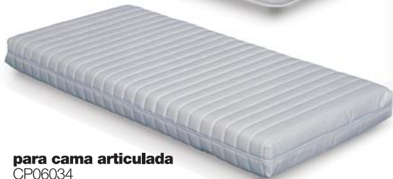
para cama articulada CP06034